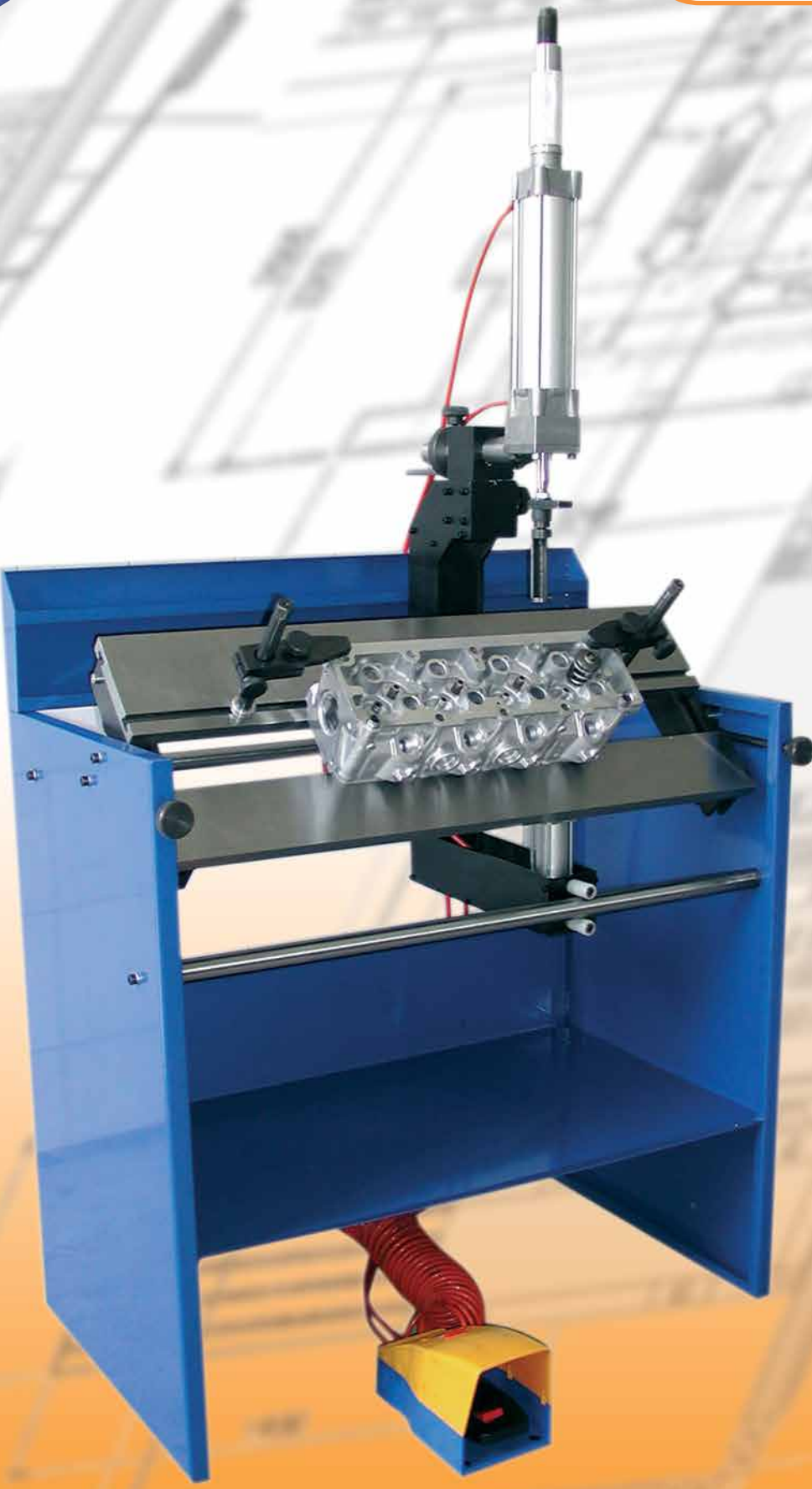
BANCO DI SUPPORTO PER OPERAZIONI SULLE TESTATE MOTORE WORK STATION FOR OPERATIONS ON CYLINDER HEAD